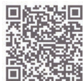
LIVRET À DESTINATION DES PROFESSIONNELS