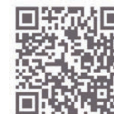
GUIDES & LIVRETS SOS PRÉMA

Vous pouvez recommander ces documents aux parents dont le nouveau-né est hospitalisé dans votre service. Ils sont consultables en ligne sur le site www.sosprema.com .