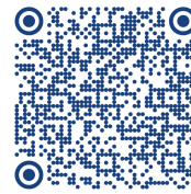
Programme 8 avril

L'association SOS Préma a adressé une carte postale symbolique aux parlementaires et acteurs de la santé pour alerter sur la place du nouveau-né hospitalisé et les conditions d'accueil des parents en néonatalogie. Elle les invite à un après-midi de réflexion le 8 avril à l'Institut Imagine de l'Hôpital Necker (Paris 15e).